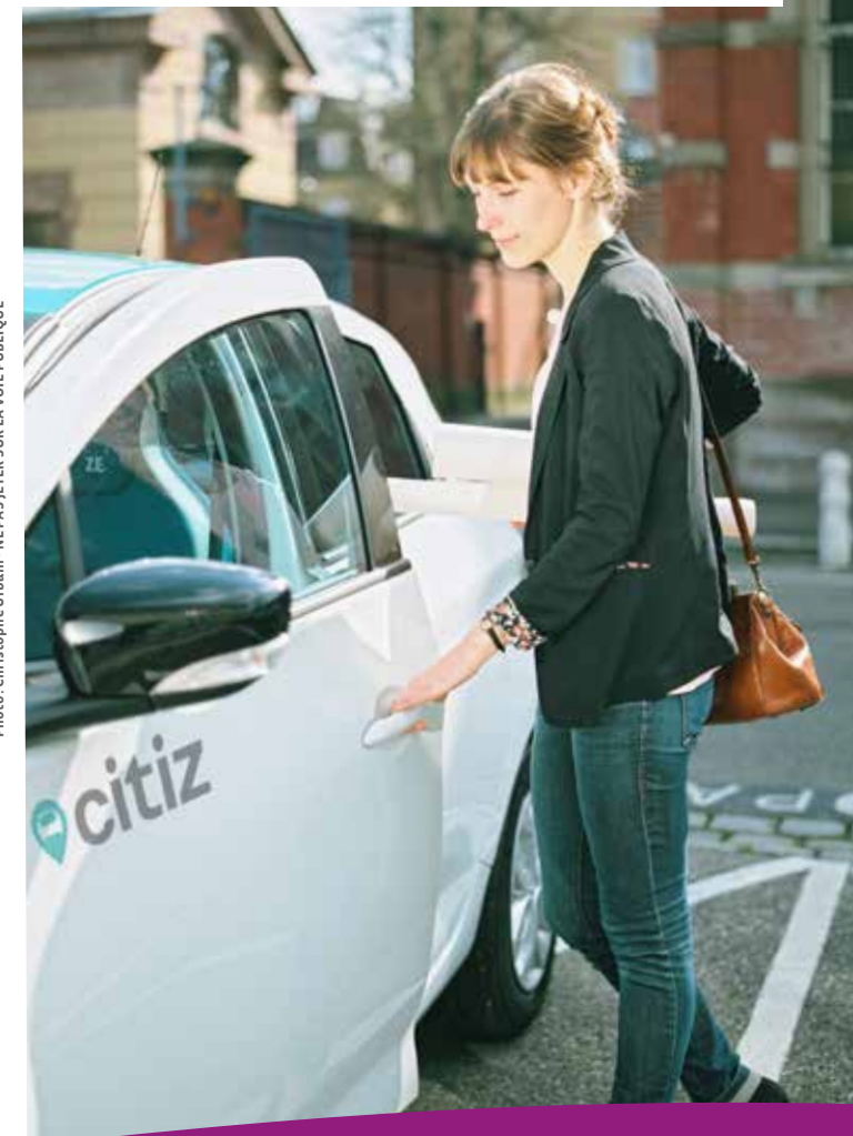
NEPAS JETER SUR LA VOIE PUBLIQUE